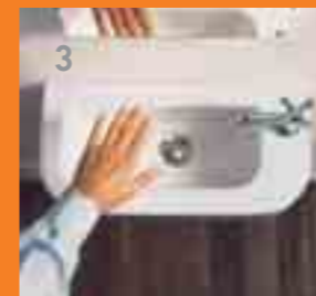
Accessoires: Serie Happy D.